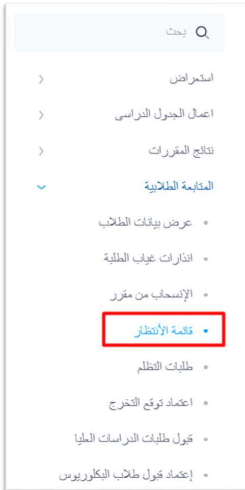
شكل ١: قائمة الانتظار

من قائمة المتابعة الطلابية يستطيع رئيس القسم اختيار شاشة "قائمة الانتظار" لعرض/الموافقة/رفض طلب الطلبة لقوائم انتظار الأقسام.