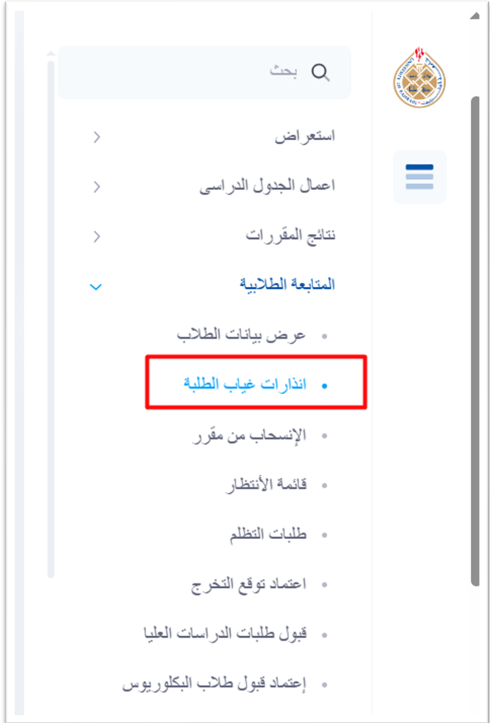
شكل ١- شاشة انذارات غياب الطلبة

يمنح النظام رئيس القسم الأكاديمي الصلاحية لعرض ومراجعة إنذارات غياب الطلاب، وكذلك عرض المعلومات العامة كما هو موضح أدناه: