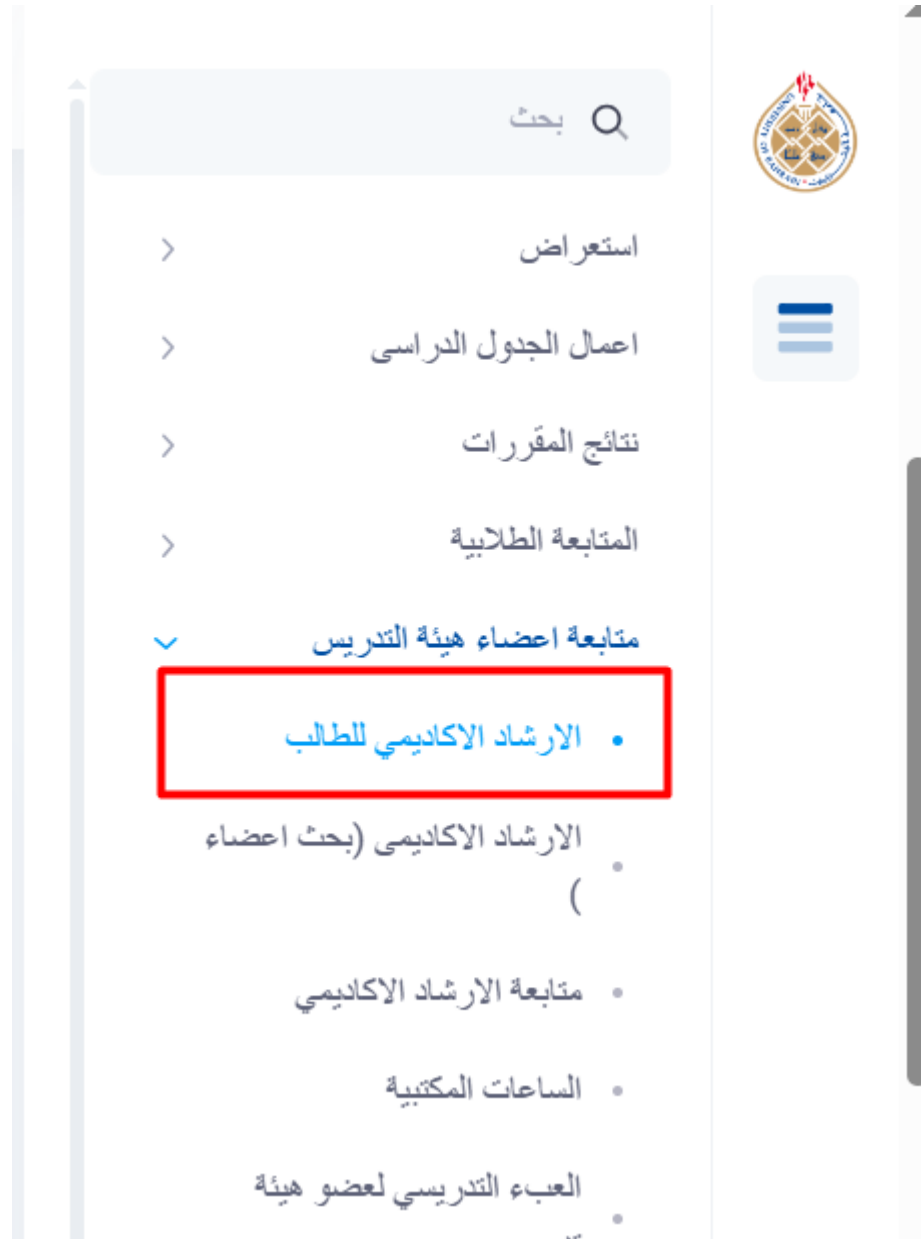
شكل ١ - شاشة الارشاد الاكاديمي للطلاب

من قائمة متابعة أعضاء هيئة التدريس، يمكن لرئيس القسم اختيار شاشة «الإرشاد الأكاديمي للطلاب» للبحث عن الطلاب المُدرّجين أو غير المُدرّجين ضمن الإرشاد الأكاديمي، وتعيينهم لمستشار أكاديمي.