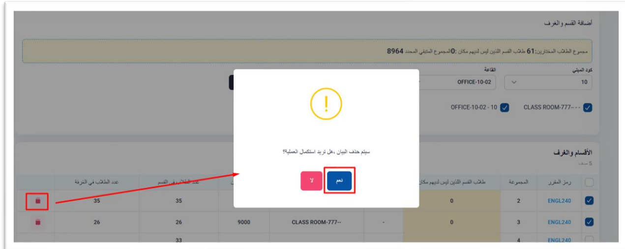
شكل ٥ : حذف الغرفة

يمكن لرئيس القسم أيضاً حذف الغرفة المضافة للقسم.