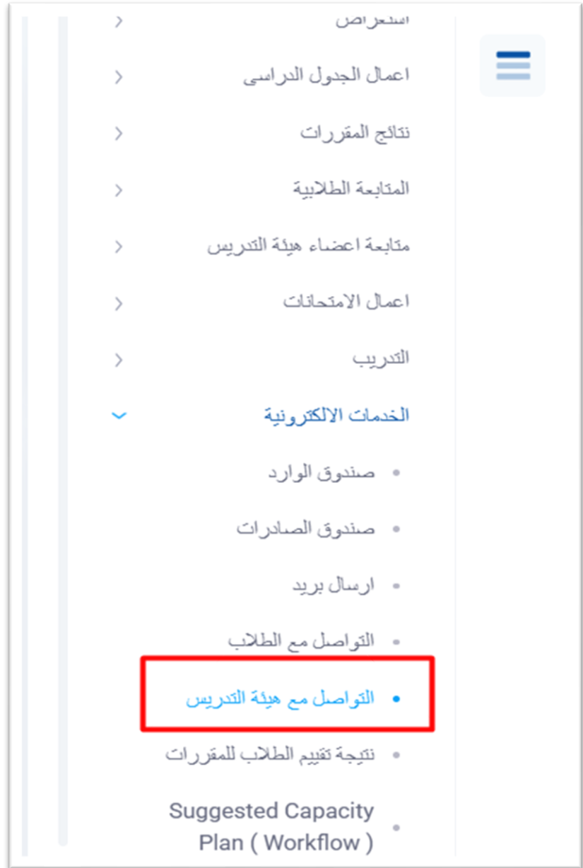
شكل ١ - شاشة التواصل مع هيئة التدريس

من قائمة الخدمات الالكترونية، يمكن لرئيس القسم اختيار شاشة «التواصل مع هيئة التدريس» لإرسال رسائل لـ أعضاء هيئة التدريس.