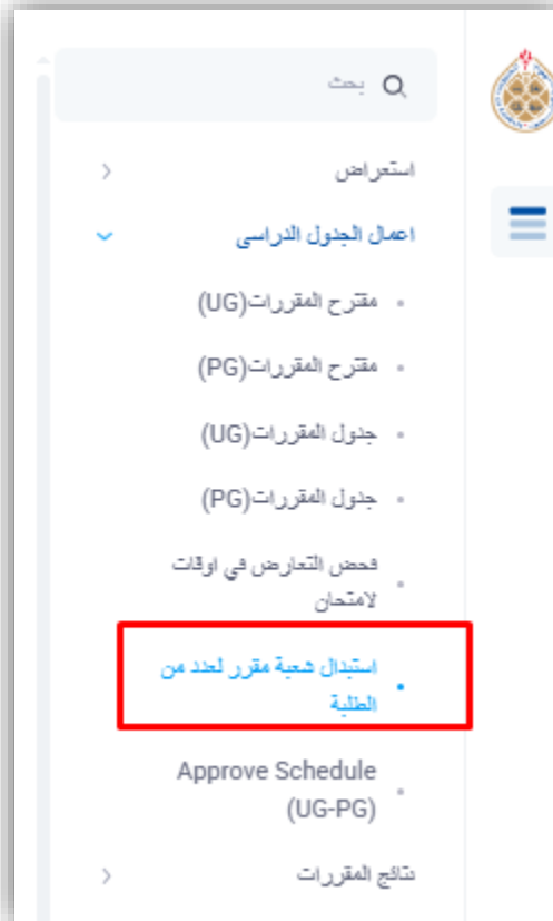
شكل ١- شاشة استبدال شعبة مقرر لعدد من الطلبة

من قائمة شؤون الجداول، يمكن لرئيس القسم اختيار شاشة "استبدال الشعبة بالجملة" (Bulk Replace Section) ، والتي تتيح للمستخدمين البحث عن مقرر محدد واختيار شعبة بديلة له.