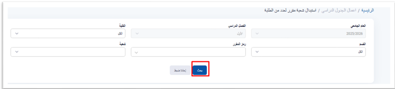
شكل ٢- زر البحث