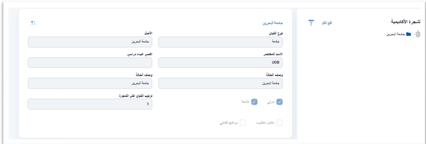
الشكل ٢- الشاشة الرئيسية للشجرة الأكاديمية

واجهة الشجرة الأكاديمية تتيح للمستخدمين التنقل وعرض وإدارة الهياكل الأكاديمية الهرمية مثل الجامعات، الكليات، الأقسام، البرامج، ومستويات الدراسة. يُظهر الجزء الأيسر هيكل الشجرة، بينما يعرض الجزء الأيمن تفاصيل الكيان المحدد.