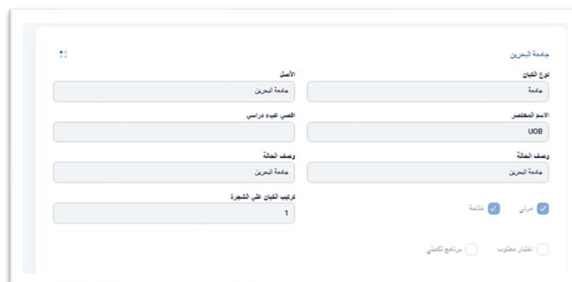
الشكل ٤- تفاصيل الكيان

يقوم بفتح جميع مستويات التسلسل الهرمي الأكاديمي بحيث يتمكن المستخدم من عرض جميع الكيانات دفعة واحدة.