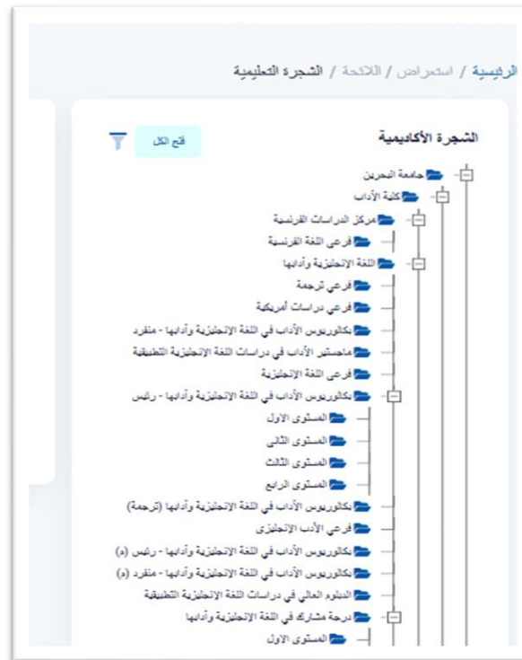
الشكل ٣- فتح الكل