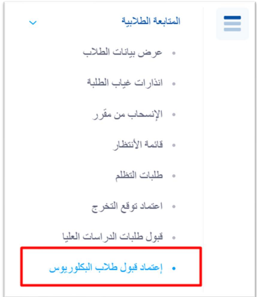
الشكل ١ - اعتماد قبول طلبة البكالوريوس

من قائمة المتابعة الطلابية، يمكن لعميد الكلية اختيار شاشة "إعتماد قبول طلاب البكالوريوس" للبحث عن المتقدمين وتحديد مواعيد المقابلات، واتخاذ الإجراءات اللازمة بشأن المتقدمين الجدد لقسمه.