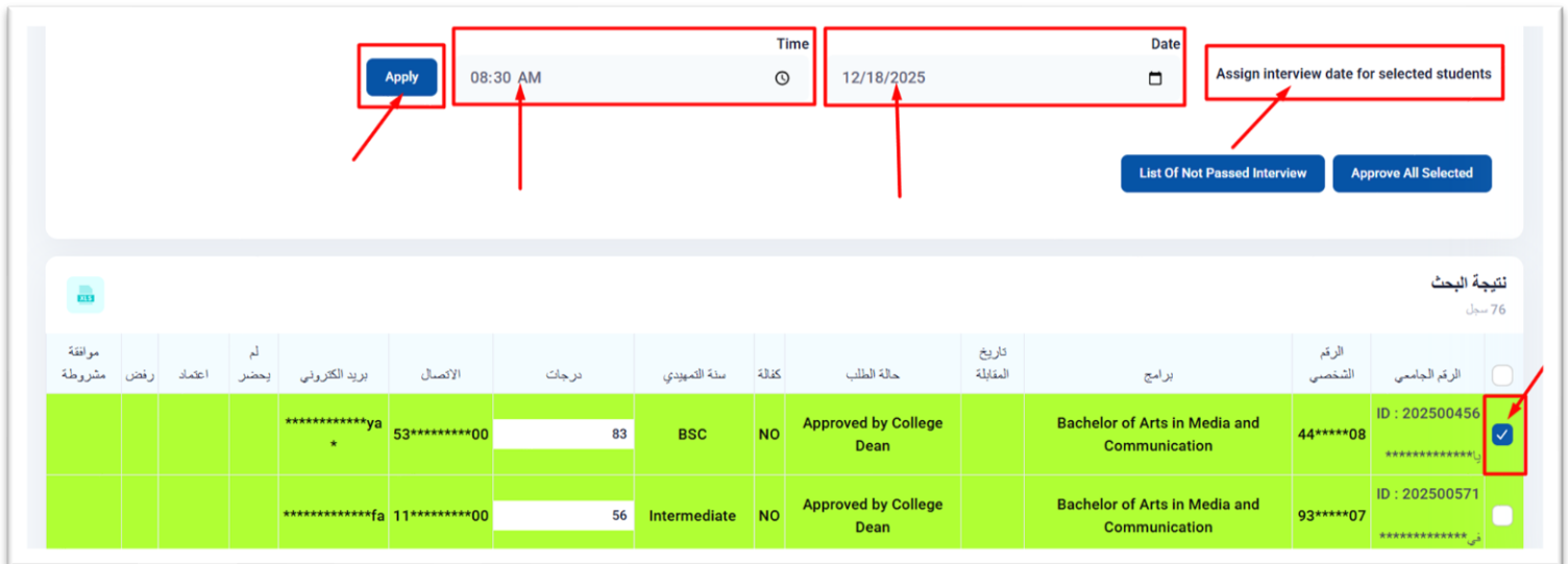
Figure ٣ - تحديد موعد المقابلة للطلبة المختارين

يمكن لعميد الكلية تعيين موعد مقابلة لمتقدم محدد. يقوم عميد الكلية بإدخال "تاريخ" و "وقت" صالحين. يختار عميد الكلية مقدم الطلب. ثم يضغط على زر "تطبيق". يعرض النظام تاريخ المقابلة في الجدول.