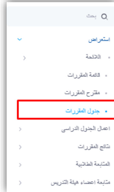
شكل ١: شاشة جدول المقررات

من قائمة العرض، يمكن لعميد الكلية اختيار شاشة "الجدول الدراسي" للبحث وعرض جداول المقررات الخاصة بالقسم.