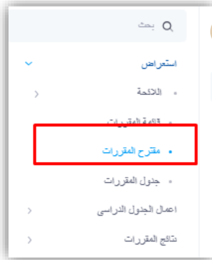
شكل ١ : شاشته مقترح المقررات

من قائمة العرض، يمكن لعميد الكلية اختيار شاشة "مقترح المقررات" للبحث وعرض المقررات المتاحة في القسم.